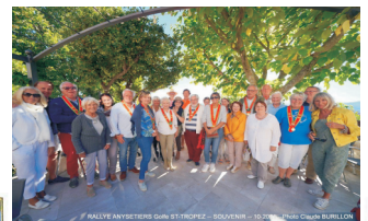
RALLYE D'AUTOMNE Organisé par la Commanderie des Anyssetiers du Golfe de Saint-Tropez Le jeudi 6 octobre 2021 DANS LE MOYEN ET HAUT-VAR